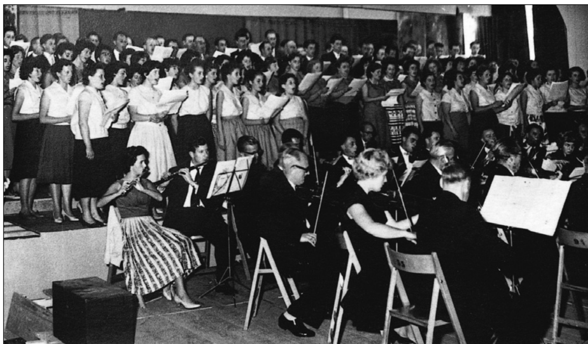
Het gelegenheidskoor met het Kempisch Orkest.