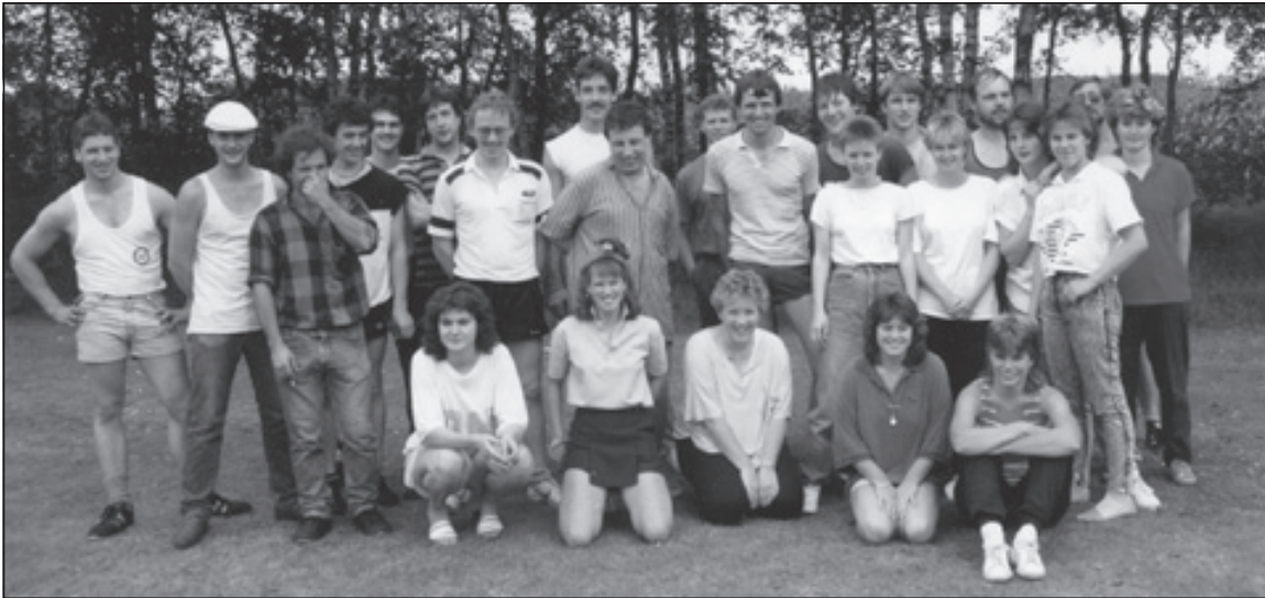
De leiders en leidsters van Jong Nederland Reusel in de tachtiger jaren.

vele vrijwilligers die zich hier nu voor inzetten. Lange tijd reed ik in een oude Toyota Starlet. Deze werd door leiding en leden heel vaak gebruikt. Zo'n allemansvriend had veel te lijden. Aan weerskanten kwamen er deuken in de deuren, ook de benzine-meter werkte niet meer en het contactslot was kapot. Daarom moest er gestart worden met een schroevendraaier. Gevraagd en ongevraagd lenen van mijn 'good old' starlet was op eigen risico. Kreeg het wagentje onderweg kuren dan was ik meestal degene die het oudje weer aan de praat kreeg en daar kon ik dan weer van genieten.