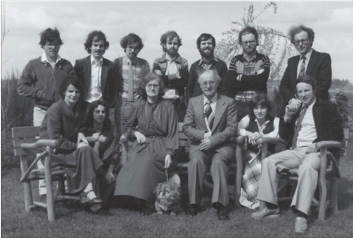
Ons ouderlijk gezin in 1979 op de dag dat onze pa en ons moeder 35 jaar getrouwd waren. Tussen mijn ouders in ons hondje Plukkie.

later werd die Molenhut genoemd, dat is tot op de dag van vandaag zo gebleven.