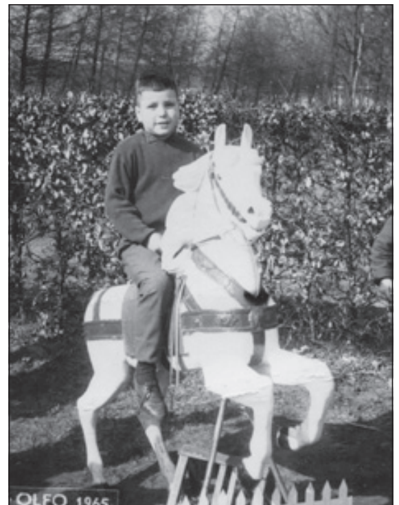
In 1965, tijdens mijn lagerschooltijd, mocht ik ook op het bekende witte paardjesmolenpaard van de fotograaf zitten.

Tien maanden na het huwelijk van mijn ouders werd mijn oudste zusje geboren en zeventien