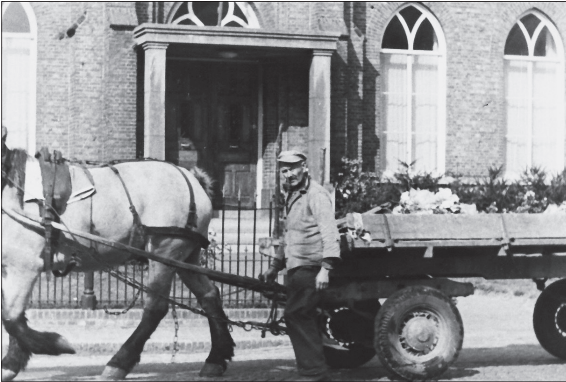
Onze pa tijdens het ophalen van huisvuil, omstreeks 1955.