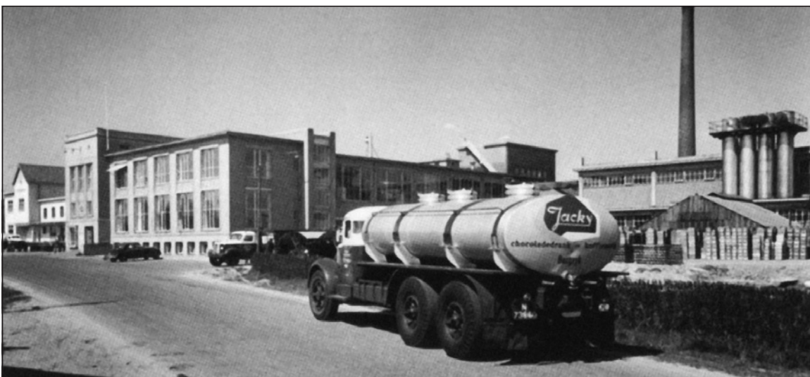
't Stoom te Bergeijk zoals het eruit zag toen ik daar in 1951 ging werken

De T.N.I. strijders zaten vaak verborgen tussen de gewone kampongbewoners. Het gevaar lag altijd op de loer. Op een keer werden we opeens beschoten door een T.N.I. strijder die ogenschijnlijk als een boer z'n land aan het ploegen was. Het spreekt vanzelf dat we door dat voorval gewaarschuwd waren en altijd eerder probeerden te schieten dan de vijand. Dat er daardoor ook wel eens onschuldige boeren het slachtoffer werden, is niet uitgesloten. Nog in diezelfde maand op 15 december 1947 viel een patrouille van 7 infanteristen van ons bataljon in handen van de T.N.I. Ze werden afgeslacht en in het water teruggevonden. In stilte hebben we onze makers begraven. Ze kregen in Ganoeng-Batoe een voorlopige begrafenis. Hun dood maakte