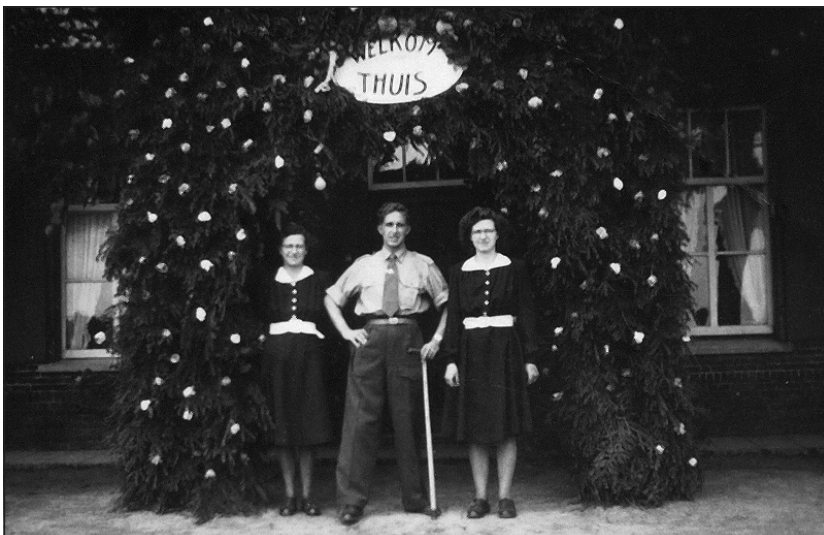
Behouden thuiskomst uit Nederlands Indië in mei 1950. Hier sta ik onder de ereboog tussen mijn ouders ondersteund met een kruk omdat ik nog herstellende was van m'n gebroken been.

We werden in Rotterdam ingescheept op het schip de Kota-Baroe. Toen we langzaam Nederland achter ons zagen verdwijnen werd het stil aan boord en hadden we allemaal even onze eigen gedachten. Eenmaal op volle zee sloeg de bedrukte stemming al snel om en werden er al weer grappen gemaakt. De reis duurde vier weken en was niet luxe te noemen. We sliepen vijf hoog op harde britsen met bijna geen tussenruimte. Ook moesten we wennen aan het eten want er werd geleidelijk overgeschakeld naar Indisch eten. De aardappels werden vervangen door rijst. Voor mij was alles nieuw en ik verwonderde me over wat ik onderweg zag. Zoals de woeste zee in de Golf van Biskaye waar veel jongens zeeziek werden, de Rots van Gibraltar en de Arabieren die in het Egyptische Port Said hun koopwaar aan ons probeerden te slijten. Nadat er bijgetankt was en alle levensmiddelen aan boord waren ging het de Rode Zee op en zagen we