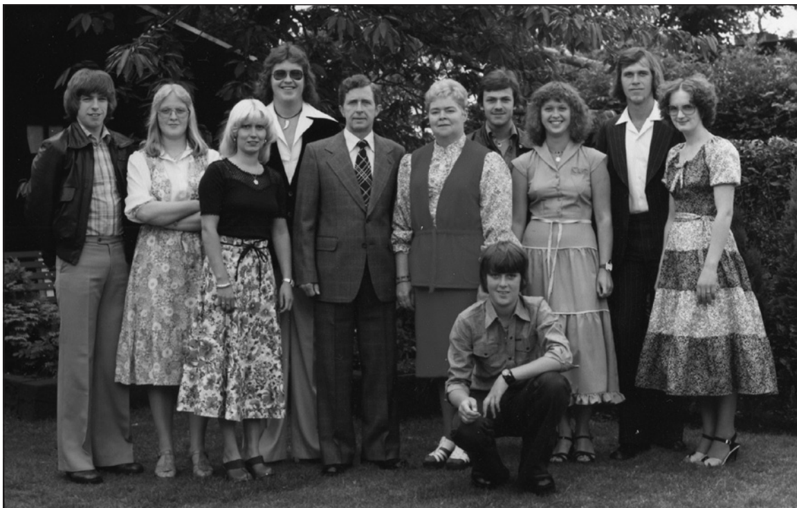
Onze kinderen met hun echtgenoten tijdens onze zilveren bruiloft in 1978.